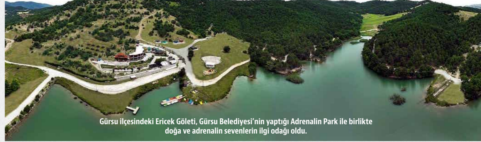
Gürsu ilçesindeki Ericek Gölü, Gürsu Belediyesi'nin yaptığı Adrenalin Park ile birlikte doğa ve adrenalin sevenlerin ilgi odağı oldu.

Şehirden uzakta doğa ile baş başa kalmak isteyen doğa severler, kampçılar, balıkçılar ve fotoğrafçılar için harika bir yer Ericek Gölü. Göl, Gürsu Belediyesi'nin yaptığı Adrenalin Park ile birlikte doğa ve adrenalin sevenlerin ilgisini çekmeye başladı. Katırlı Dağları'nın eteklerinde bulunan Göl, şehirden uzakta doğa ile baş başa kalarak haftanın yorgunluğunu atabileceğiniz bir yer. Gölün etrafındaki festival alanında her yıl Mayıs ayının son haftasında Hıdırellez şenlikleri ve pilav günü yapılıyor. Gürsu'da eko turizmin gelişimini sağlamak amacıyla, Gürsu Belediyesi'nce Ericek'te oluşturulan ve bir ilk olma özelliği taşıyan Gürsu Adrenalin Park, yeni yüzüyle doğa ve adrenalin tutkunlarını çağırıyor. Birçok doğa sporunu bir arada yapma olanağı sunan Adrenalin Park, Gürsu Belediyesi'nce yapılan düzenleme çalışmalarıyla daha konforlu hale getirildi. Rengarenk bungalov ve hobbit evleriyle, yaz kış muhteşem manzaralar oluşturan doğasıyla Adrenalin Park, misafirlerini ağırlıyor.