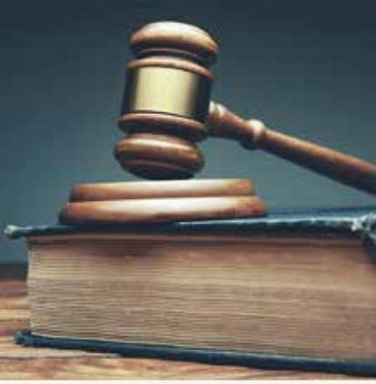
Egemenoğlu Hukuk Bürosu

Anonim şirketler, 6102 sayılı Türk Ticaret Kanunu (TTK) ve Ticari Defterlere İlişkin Tebliğ uyarınca zorunlu olarak birtakım defterler kullanmak, bu defterleri belirli bir süre boyunca saklamak, açılış-kapanış ve bazı defterlerin de ara onayını yaptırmak zorundadır.